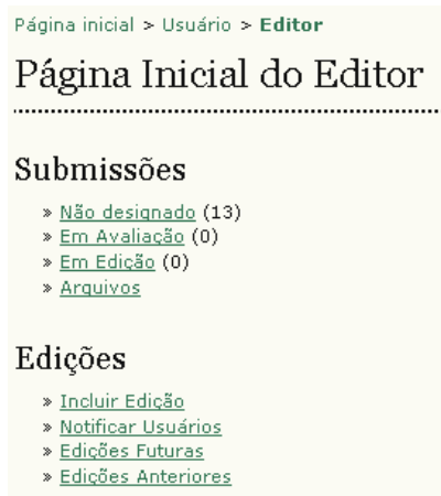
Figura 105: Menu do Editor

Em ‘Submissões’ estarão disponíveis as submissões ‘Não designadas’, ‘Em avaliação’, ‘Em edição’, ou no ‘Arquivo’. Ao clicar em qualquer um desses links , serão exibidos detalhes de cada submissão para cada uma dessas categorias: