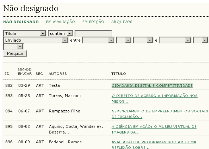
Figura 106: Selecionando um artigo não designado

Escolha ‘Não designado’ e clique no título, como link , de um artigo.