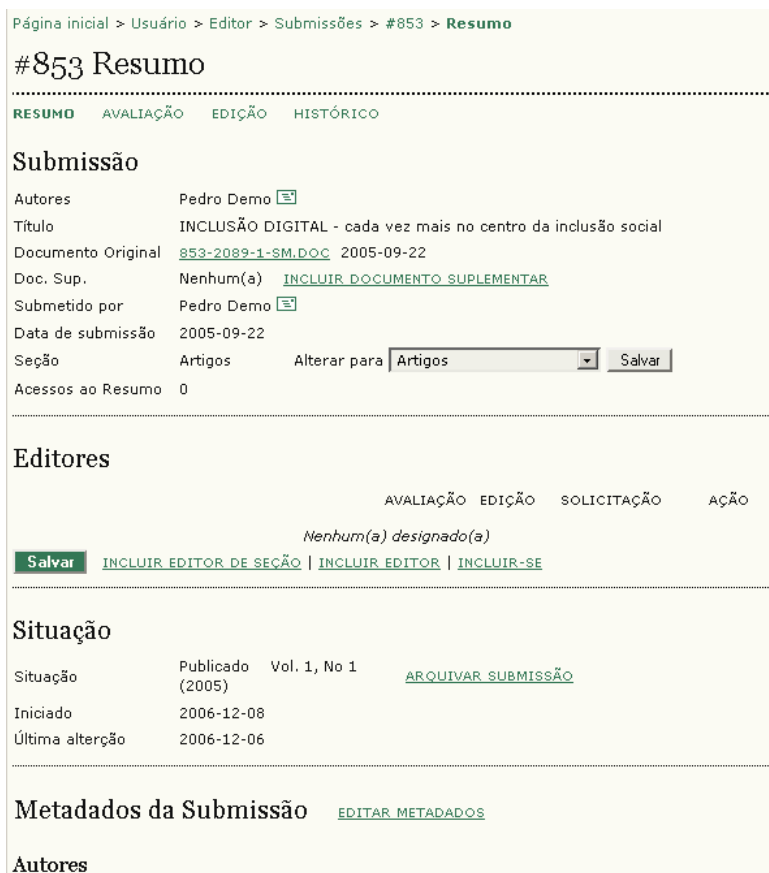
Figura 107: Página de resumo de artigo não designado

Na página ‘Resumo’, veja a seção ‘Submissão’: