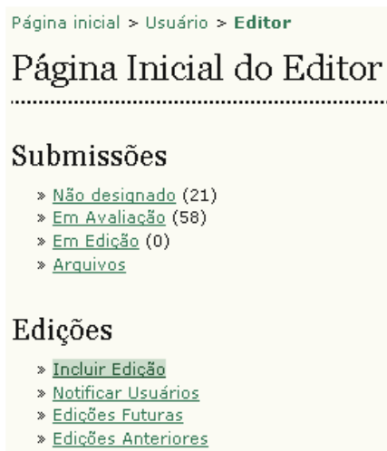
Figura 112: Menu do Editor

Em 'Edições', estão disponíveis as seguintes opções: